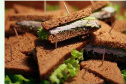
Uzkodas DUS Dublinā 6 eiro