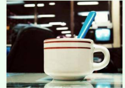
2 kafijas un rieksti DUS Dženovā 4.90 eiro