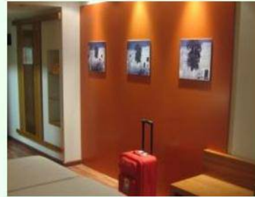
Viesnīca Luksemburgā uz 2 nedēļām 910 eiro