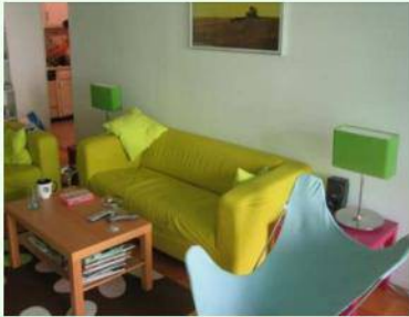
Dzīvokļa īre Berlīnē 320 eiro/mēnesī