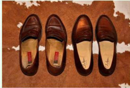
2 pāri apavu Strasbūrā 110.70 eiro