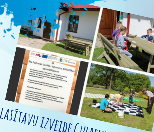
ĀRA LASĪTAVU IZVEIDE GULBENES NOVADA PAGASTU BIBLIOTĒKĀS