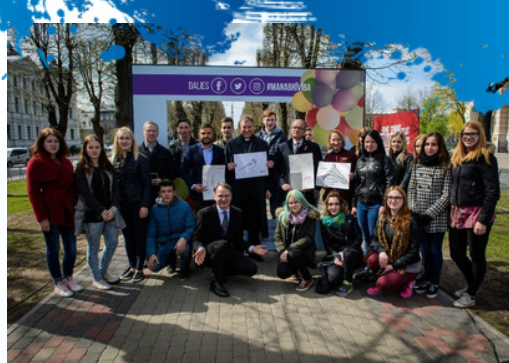
EIROPAS DIENĀ JAUNIEŠI DODAS EKSKURSIJĀ UZ RĪGU