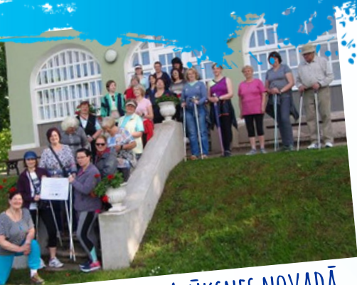
DŽĪVO VEELS ALŪKSNES NOVADĀ